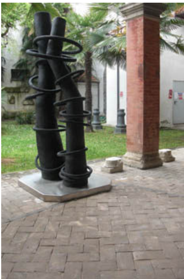
Immagine dell'installazione dell'opera